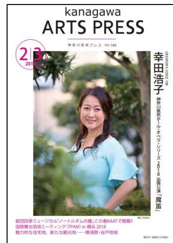
「神奈川芸術 PRESS」2018年2・3月号