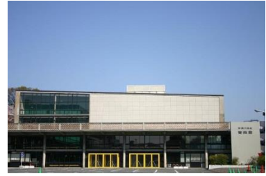
神奈川県立音楽堂

※次頁以降の凡例（ 公1 、 収1 、 収2 、および 法人 ）は、公益認定および会計上の分類を示す。