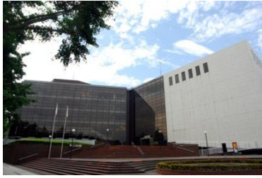
神奈川県民ホール